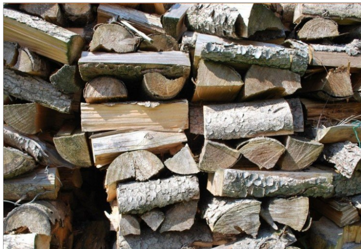
Auf dem Land