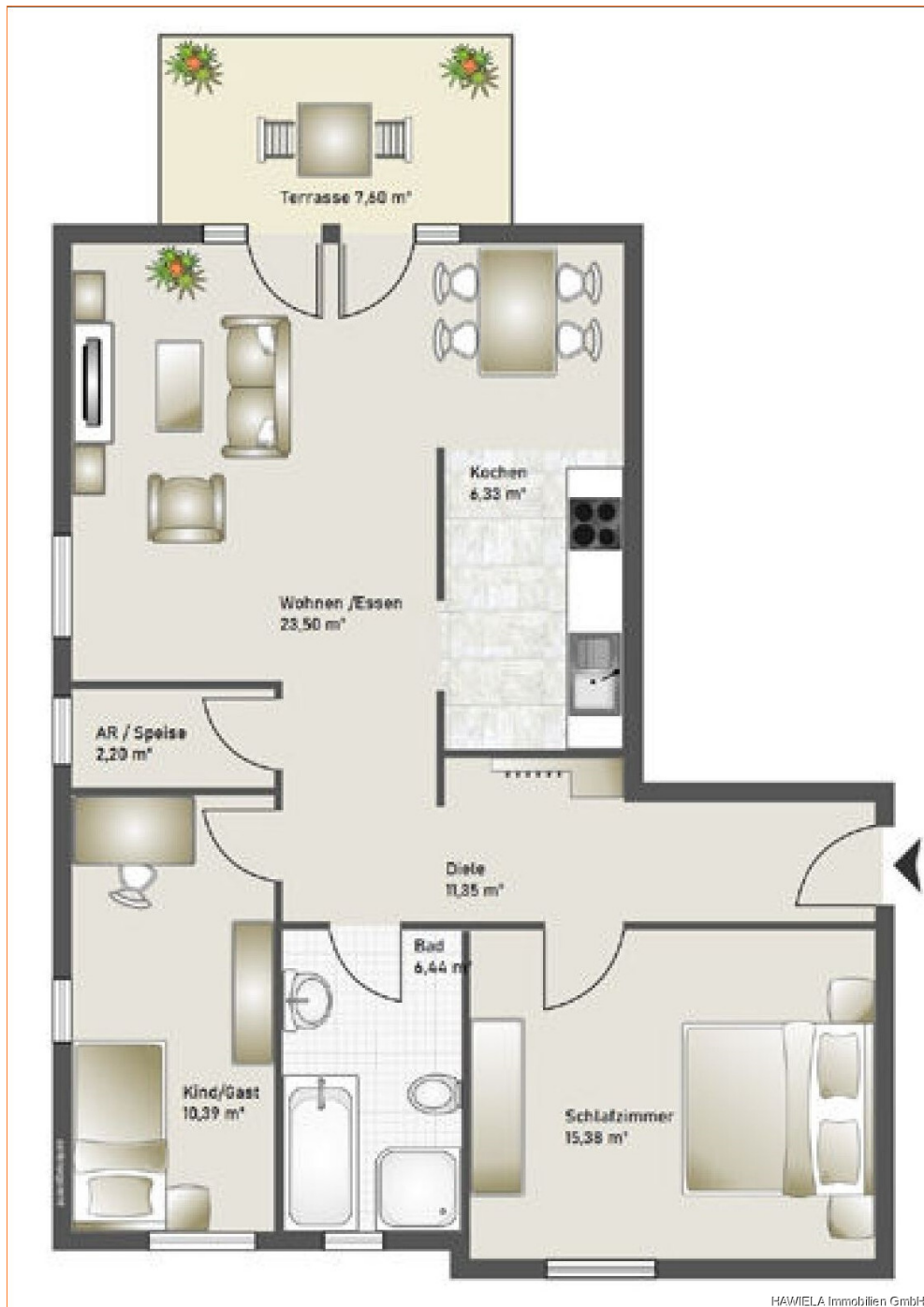
Grundriss Nr. 3