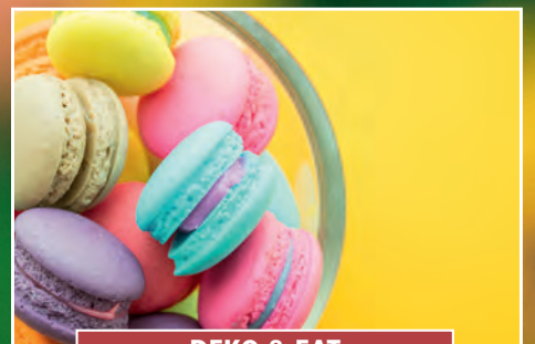
DEKO & EAT